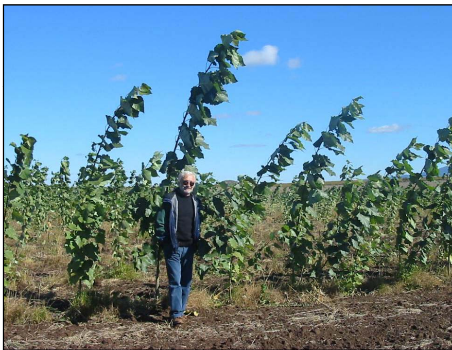
Crecimiento de los distintos híbridos ensayados