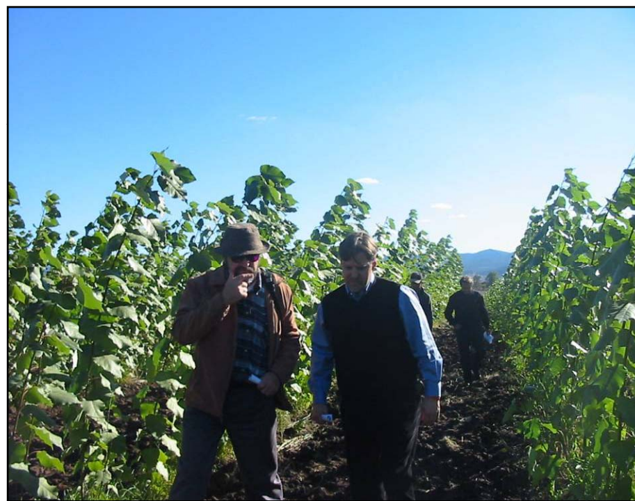
Visita demostrativa del ensayo