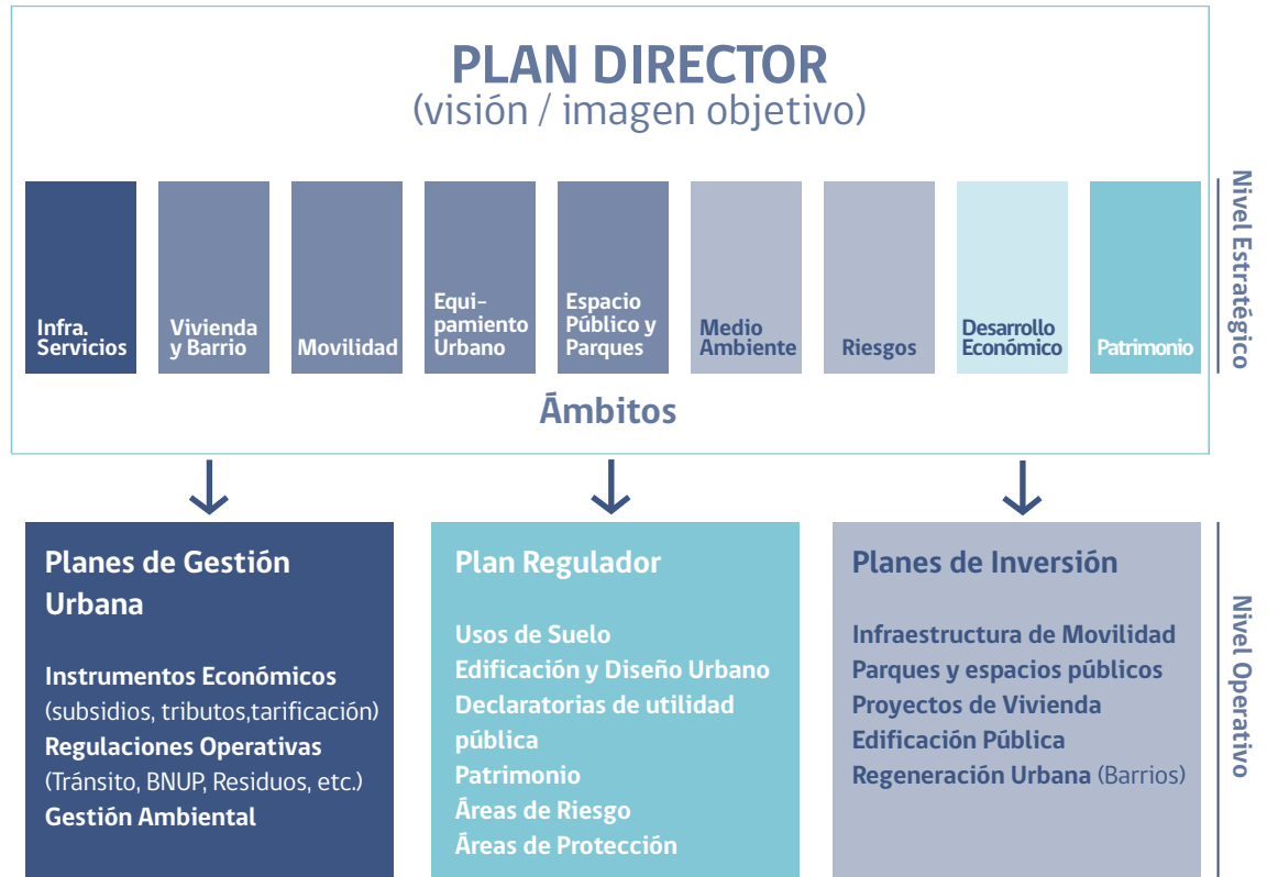
Figura 3: Esquema de Plan Director de Ciudad y su relación con planes operativos y seccionales 39