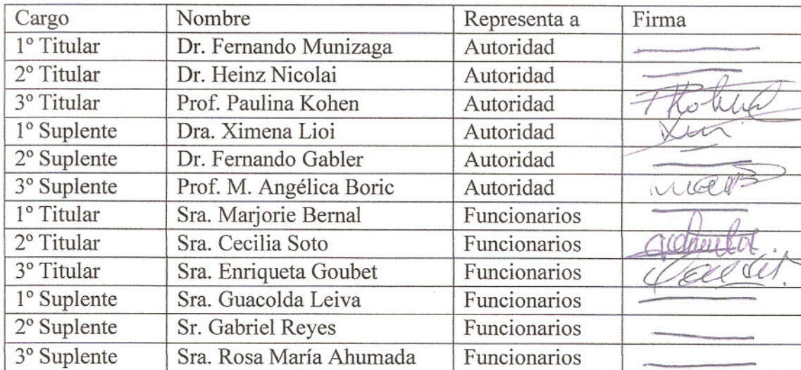
Tabla N° 2