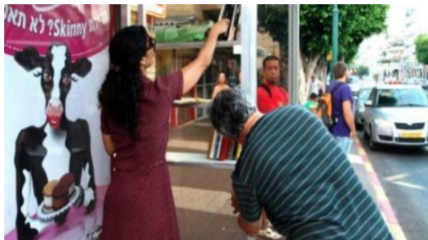
Proyecto: Bibliotecas públicas libres en paraderos en Israel:

“Su lema: Usted puede tomar, usted puede devolver, usted puede agregar”.