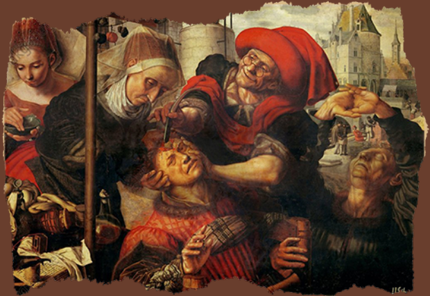
Removing a Stone. Jan Sanders van Hemessen, s XVI.

“La nueva legislación italiana para tratamiento ambulatorio de los ofensores no imputables”