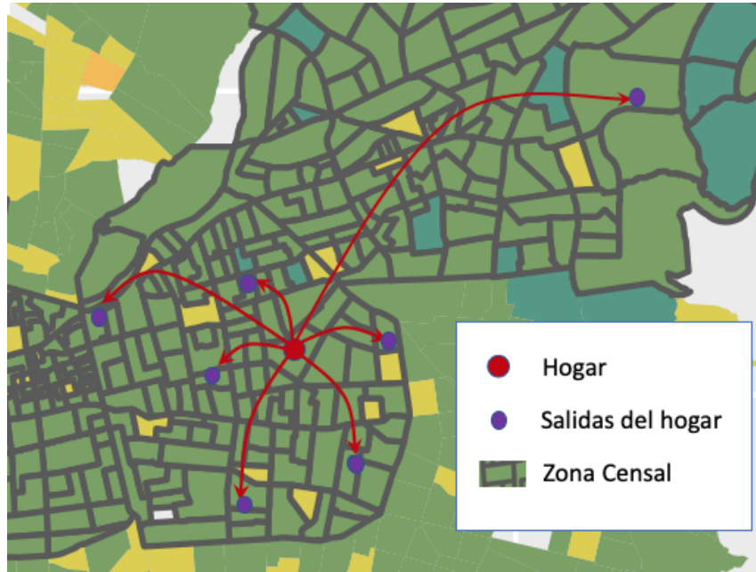
Figura 1 - Metodología para medir flujos fuera del hogar a nivel de zona censal.