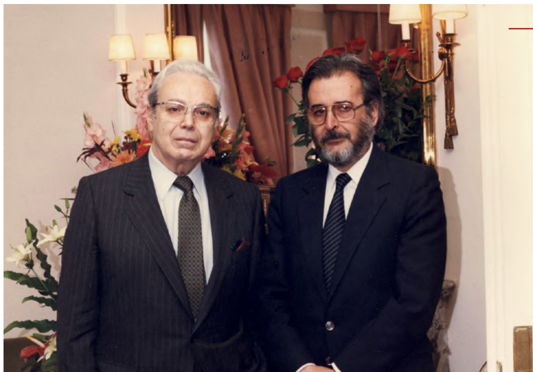
Con director RyP, en España, 1986.