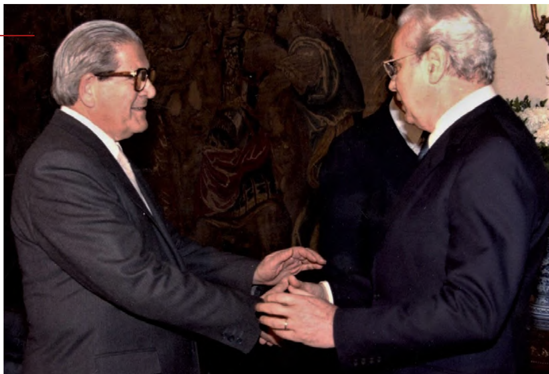
Con ex canciller Enrique Silva Cimma, en Chile, 1991.