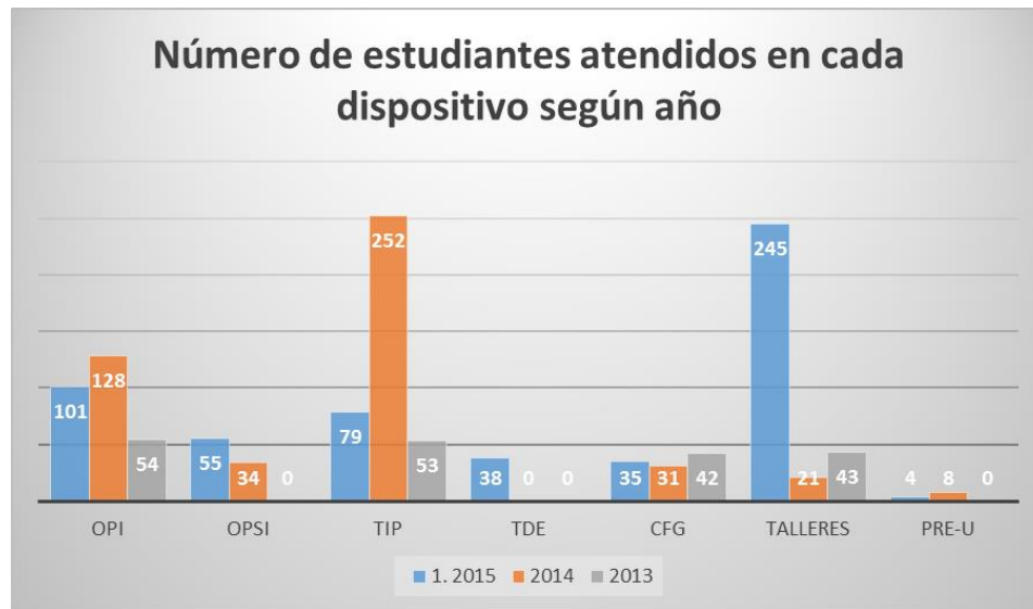
Gráfico 2 : Desde la instalación del CeACS, el incremento dado en el número de atenciones y dispositivos ha sido muy favorable debido a los mecanismos de difusión instalados (web, Facebook, u-curso, afiches, paneles) y de las redes de apoyos intencionadas con las autoridades y unidades locales.

Frente a lo anterior, los motivos de los y las estudiantes frente a los dispositivos de apoyo psicopedagógicos están focalizados en i) dificultades de hábitos de estudio, ii) bajo rendimiento frente a las exigencias académicas, y iii) dificultades de concentración y memoria. Del mismo modo, las demandas en aspectos psicológicos están atribuidos a i) dudas vocacionales, poca confianza y/o seguridad en sí mismo, y iii) y falta de manejo frente al estrés e irritabilidad. Y desde las solicitudes en aspectos disciplinares, se centran en dificultades de i) bajo manejo en Ciencias Básicas (Cálculo, Física, Química), ii) Escasas estrategias y hábitos de estudio en asignaturas críticas y iii) dificultades para entender las evaluaciones en asignaturas críticas.