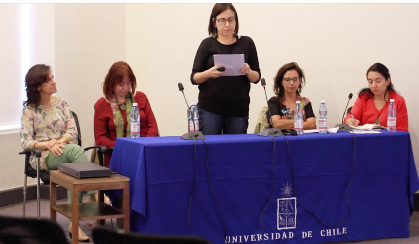
Jornada “Educación con niños y niñas de hoy” realizada en Casa Central en el marco de la III Semana de las Pedagogías.