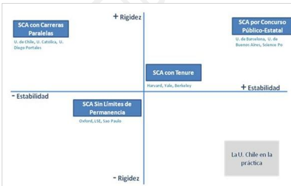
Cuadro 3. Estabilidad/Rigidez de los Sistemas de Carrera Académica

Este es el único sistema que cuenta con un proceso de evaluación obligatorio y aplicable a todos los nombramientos. Debido a la universalidad de la evaluación del desempeño vinculante no existen posiciones equivalentes al Tenure, pues los Profesores Titulares pueden ser desvinculados en función del desempeño, y no solo mediante un proceso de sumario interno (como sucede con los nombramientos no desvinculables de todas las universidades analizadas). Así, a diferencia de otros sistemas, en este caso no se presenten nombramientos no desvinculables. El sistema de Carrera Académica con Carreras Paralelas a diferencia del resto presenta una multiplicidad de mecanismos o flujos de ingreso, promoción y evaluación del desempeño, que combinan elementos característicos de los demás sistemas de carrera académica. En definitiva se trata de un sistema rígido, con gran cantidad de normativas para controlar los flujos mencionados en la Carrera Académica. A la vez, es un sistema inestable, considerando que incluso los profesores titulares pueden ser desvinculados en virtud de su desempeño (Ver cuadro 3).