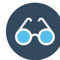
OPTICA, AUDIFONOS, APARATOS ORTOPÉDICOS