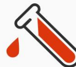
EXAMENES DE LABORATORIO