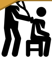
MEDICO A DOMICILIO

El (la) socio(a) que requiera aplicar un convenio, debe acercarse a Bienestar y solicitar una orden de compra (con presupuesto u orden. El plazo dependerá de su antigüedad como socio(a) y de su calidad jurídica).