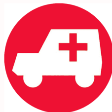
SERVICIOS DE URGENCIA