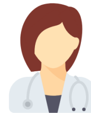
OTRAS ESPECIALIDADES MÉDICAS