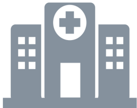
CLINICAS Y HOSPITALES