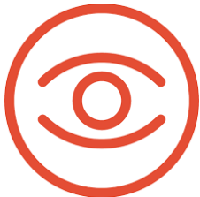
ÓPTICAS Y OFTALMOLOGÍA